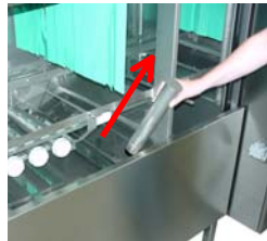
Öffnen Sie den Ablauf.