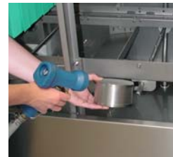
Entfernen Sie den Pumpenansaug-sieb und reinigen Sie diesen.