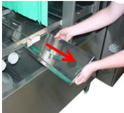
Entfernen Sie die Tankabdecksiebe.