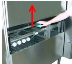
Öffnen Sie die Türen.