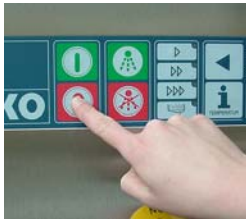
Schalten Sie die Maschine aus.

BENUTZEN SIE KEINEN HOCHDRUCKREINIGER!!!