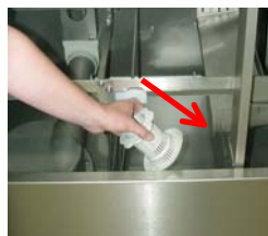
Nachdem Sie die Maschine gereinigt haben, bauen Sie alle Teile wieder ein, und prüfen Sie diese auf Vollständigkeit und richtige Position.