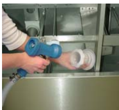
Reinigen Sie den Ablauf-sieb.