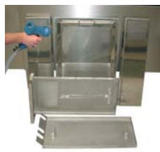
Reinigen Sie alle Siebe.