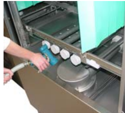
Reinigen Sie den Tankinnenraum mit einem Wasser-schlauch.