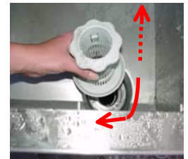
Entfernen Sie den Ablauf-sieb.