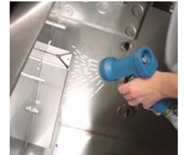
Schwimmergehäuse der Wasserstandsüberwachung abspritzen.