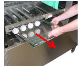
Entfernen Sie die Tankabdecksiebe.