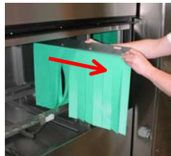
Entfernen Sie alle Spritzschutzvorhänge, und reinigen Sie diese.