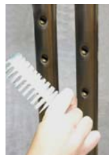
Reinigen Sie die Wasch- + Nachspülar-me und deren Düsen. Zum Reinigen der Düsen, benutzen Sie eine Nylon Bürste. Überprüfen Sie die Waschar-me und Endkappen auf Vollständigkeit und Dichtheit.