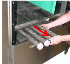
Entfernen Sie die Waschsyste-me und die Nachspülar-me.